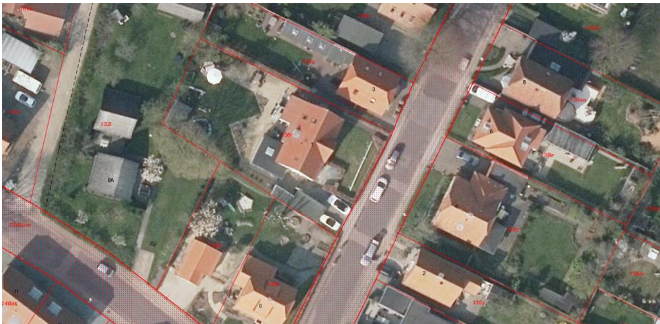
Luftfoto fra Varde Kommunes kortdatabase (Elmealle 1 midt på luftfoto)

Såfremt projektet reduceres til alene at omfatte garagen vurderes det ikke umiddelbart at ville påvirke oplevelsen af hovedhuset, men for konkret stillingtagen forudsætter det, at vi får et bedre tegningsgrundlag.